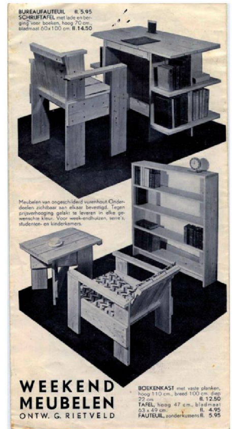
Brochure publicitaire de 1935 pour un ouvrage de meubles à faire soi-même

Aujourd'hui, l'heure n'est plus aux manifestes. Nous sommes au temps des séries limitées, des rééditions fidèles, de l'orthodoxie et du purisme stylistique érigés en manière. Autant dire qu'à Vitra, ce temple du consumérisme raffiné, Rietveld s'expose dans ce contre quoi il a lutté toute sa vie. CC