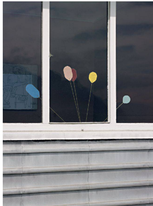
Les fleurs du lac, ECAL-Jonathan Vallin