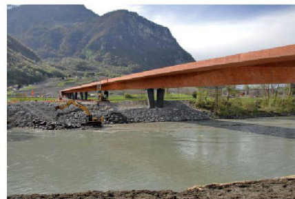
La ligne rouge

Un geste fort pour les transports publics Roland Kobel, propos recueillis par Daniela Dietsche et Lukas Denzler, traduit par Jacques Perret