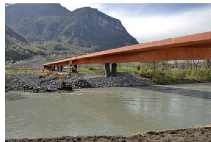
La ligne rouge