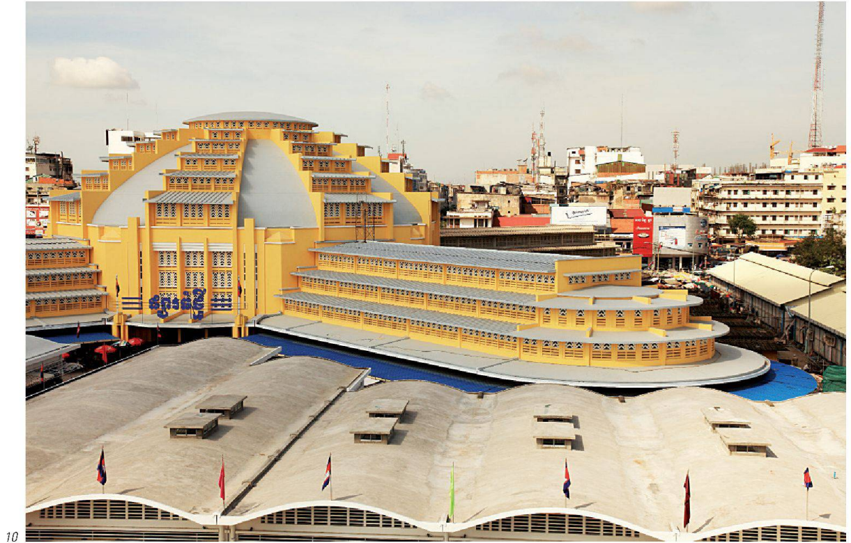
Fig. 12 à 15: Le marché avant sa rénovation