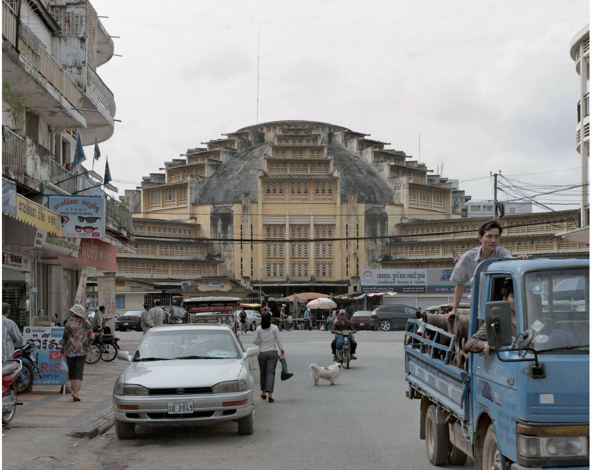
Fig. 18 : Porche d'entrée, allée est et haies rénovées du marché central de Phnom Penh