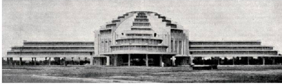
Fig. 2 et 3 : Le marché à son inauguration