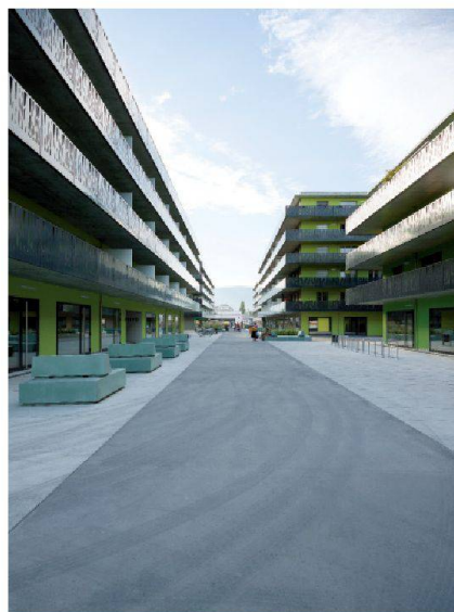
L'axe central du quartier, la rue de la Coupe Gordon-Bennett

Donnez la capacité totale de mouvement à la structure de l'immeuble et créez ainsi une utilisation optimale – Esthétique comprise évidemment!