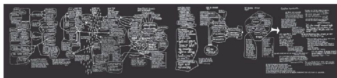
Victor Papanek, « Flow chart » from the Scandinavian Student Design Organization conference, Copenhagen (1969), in Victor Papanek, Design for the Real World: Making to Measure (éd. Thames and Hudson, Londres, 1971)