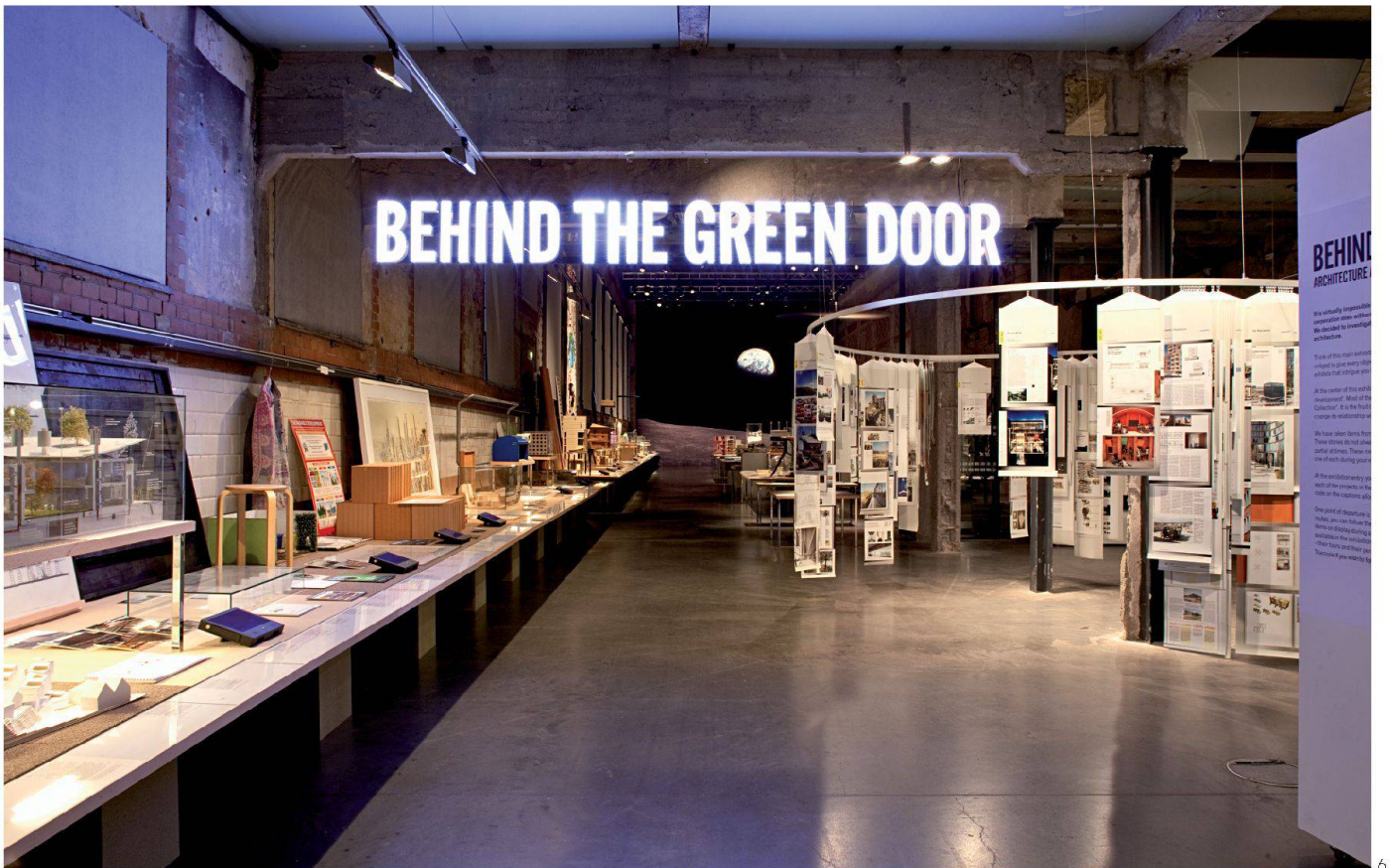
6 Vue de l'exposition Behind the Green Door