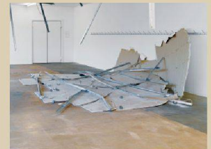
Delphine Reist, La Chure , 2013