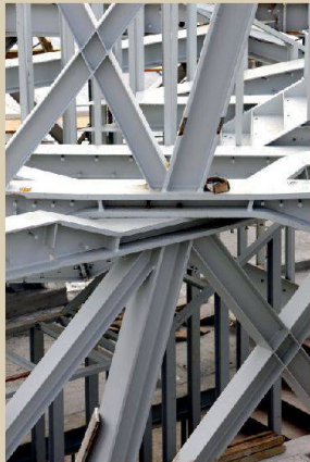
Actelion Business Center, Allschwil

Architekturfoyer, HIL, ETH Zürich www.ausstellungen.gta.arch.ethz.ch