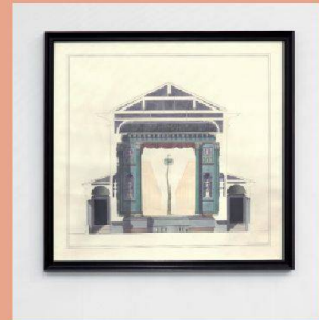
Pablo Bronstein. Dancing Girl on a Palm Tree, 2012. Courtesy the artist and Galleria Franco Noero, Torino (Photo Sebastiano Pelloni di Persano)