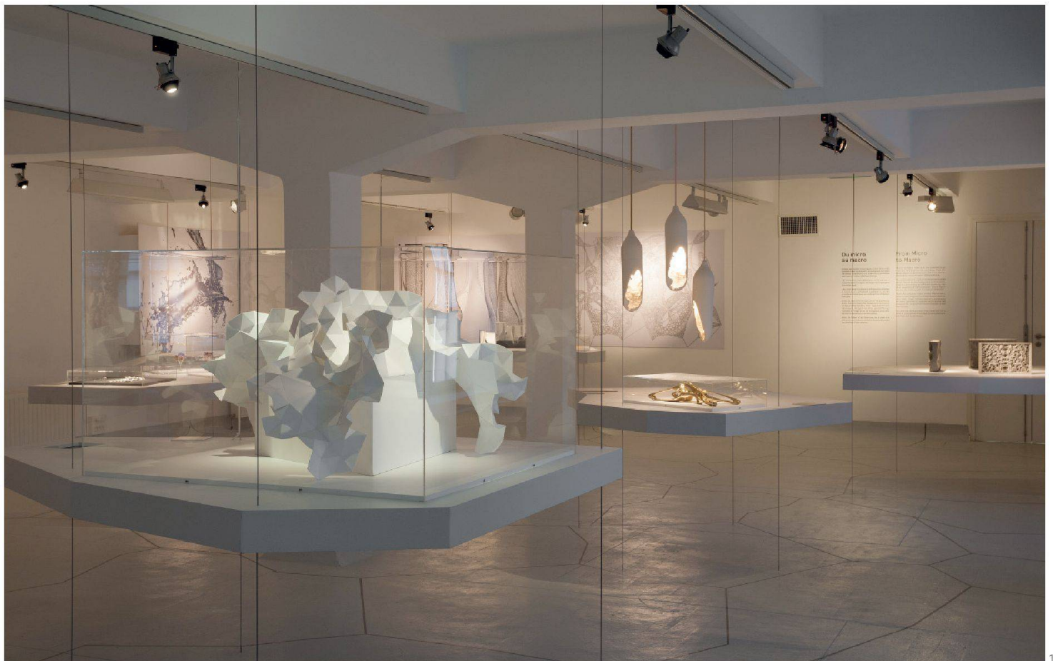
1 Vue de l'exposition « ArchiLab - Naturaliser l'architecture »

A la fin de votre introduction au colloque Architecture et sciences: une nouvelle naturalité (24.10.2013), vous présentez un rôle nouveau qui reviendrait aujourd'hui aux architectes. Vous dites que, puisqu'ils travaillent sur la limite entre nature et artifice à l'aide d'outils de simulation génératifs, ils peuvent devenir prescripteurs et définir les limites de l'éloignement de la règle de la nature, de la licencia (Vitruve). Mais pourquoi les architectes plutôt que les designers, les artistes ou directement les scientifiques? Qu'est-ce qui les rend plus aptes à devenir les médiateurs de ce changement?