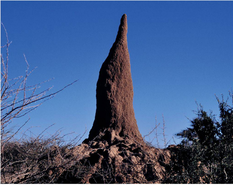
< Termitière en Namibie, license Creative Commons Attribution-Share Alike 3.0 Unported

tière (fig. 3) se déroule sans plan préétabli et sans vision d'ensemble. Gigantesques, solides et étonnamment complexes, ces constructions disposent même de conduits d'aération. Le tout sans architecte et sans recopiage d'un plan. S'agirait-il d'un héritage génétique? Qu'est-ce qui là-dedans serait écrit dans leurs gènes? Au mieux, certains mouvements dont sont capables les termites, leur capacité à tourner à un certain angle par exemple, de la même manière que les papillons orientent de façon innée leur trajectoire par rapport à la position de la lune.