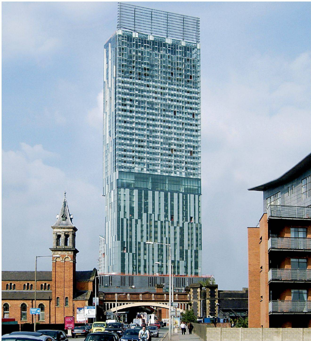
Beetham Tower, Manchester