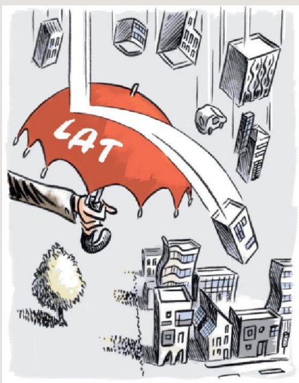
Illustration Nicolas Bischof

La révision proposée répond à ces exigences et bénéficie d'un soutien unanime à tous les échelons institutionnels. Et comme la Confédération, les cantons et les communes se partagent les responsabilités dans l'application de la Loi sur l'aménagement du territoire,