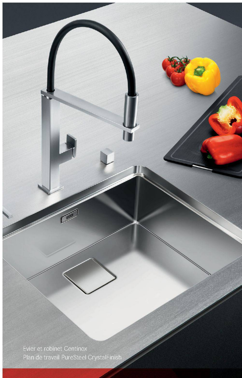
Évier et robinet Centinox Plan de travail PureSteel CrystalFinish

Si l'histoire de la construction du Lignon est passionnant, la description de la méthodologie et des résultats obtenus par l'étude du laboratoire de l'EPFL ne le sont pas moins. Ce livre aborde la question de l'émergence d'un nouveau patrimoine, celui du 20 e siècle, confronté à des exigences inédites de durabilité. Il y donne une réponse précise et fondée : les interventions respectueuses de l'existant peuvent être économiquement avantageuses et offrir de très bons résultats d'un point de vue énergétique. Comme le souhaite Franz Graf en conclusion, nous ne pouvons qu'espérer que cette étude constitue « un précieux précédent, à appliquer à un corpus d'objets similaires – production courante du second après-guerre comprise –, c'est-à-dire à la part principale du cadre bâti contemporain ». MDP