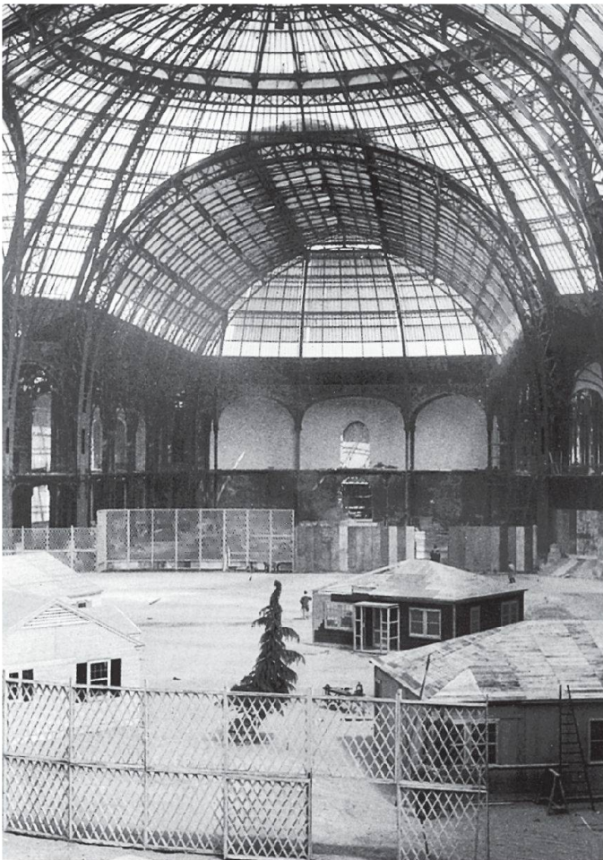
Exposition des techniques américaines de l'habitation et de l'urbanisme en 1946

Réinventer la maison individuelle en 1945.