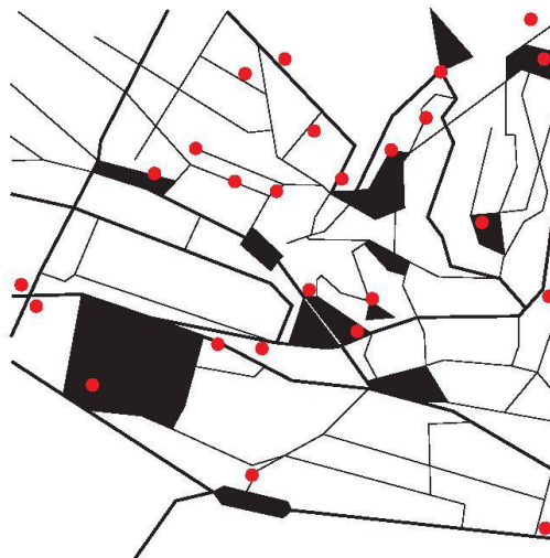
Carte des futurs sites du parcours de Lausanne Jardins 2014 (Association Jardin urbain, réalisation Gavillet & Rust modifiée par TRACÉS)