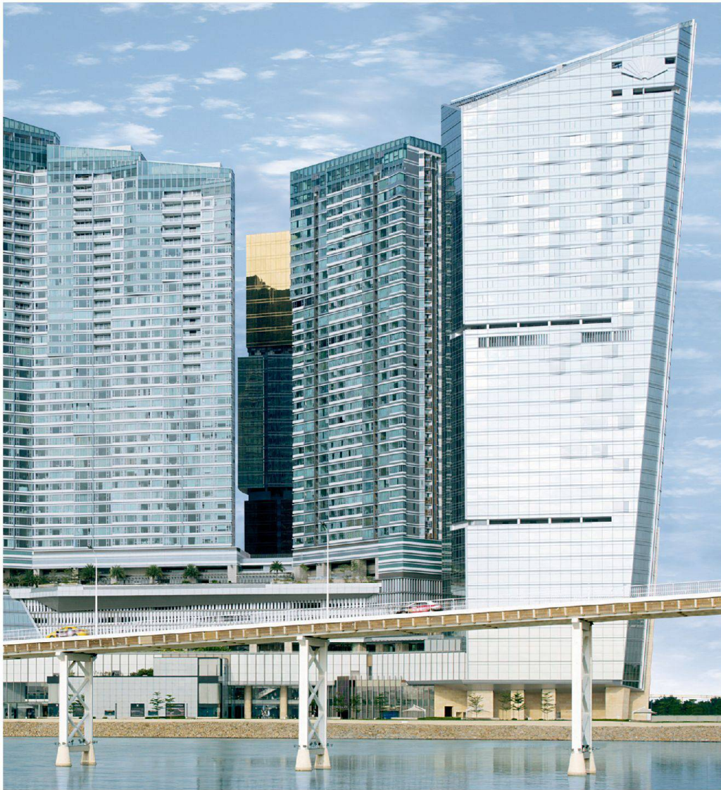
One Central, Macau