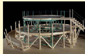
Maquette de la scène, 1924/1987

Museum Villa Stuck, Prinzregentenstraße 60, Munich www.villastuck.de