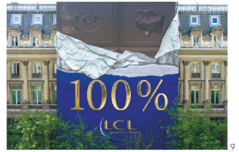
< Trompe-l'œil, Cour royale du château de Versailles, juillet 2011