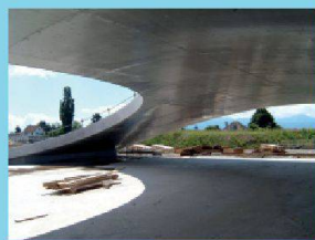
SANAA Kazuyo Sejima & Ryue Nishizawa, Rolex Learning Center, EPFL Lausanne, 2005-2010

Deutsches Architekturmuseum Frankfurt am Main www.dam-online.de