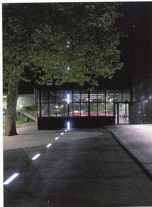
L'installation lumineuse dans la cour du théâtre Arsenic