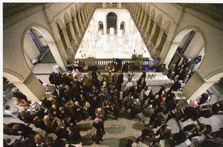
Cérémonie Regards 2013

« Jamais auparavant la société ne s'était autant préoccupée de l'avenir de la planète qu'aujourd'hui », a déclaré Markus Kägi dans son allo-