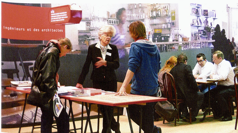
Café-conseil SIA à Habitat-jardin

17 mars 2014, Genève, 8h30 – 12h00 Code FE3, inscription : www.fe3.ch