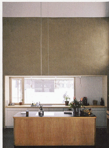
A la découverte de nouvelles techniques: maison en paille aux Cullayes, pont 12 architectes SA

Enfin, les projets primés par la distinction Umsicht-Regards-Sguardi 2013 s'invitent dans le programme des Journées SIA. Il s'agit de l'immeuble artisanal « Noerd » à Zurich-Oerlikon,