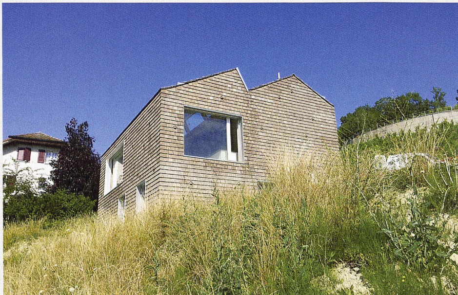
Un volume compact installé dans la pente et revêtu de tuiles pour cette maison individuelle à Valeyres-sous-Rances, bunq architectes

Lors de sa 165 e séance le 27 février 2014, la ZO a adopté les révisions des RPH SIA 102 pour les architectes, SIA 103 pour les ingénieurs civils, SIA 105 pour les architectes >>>