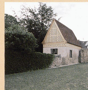
Kirche in Kaltenbach (D) Credits: Vécsey Schmidr Architekten

S AM Schweizerisches Architekturmuseum, Bâle www.sam-basel.org