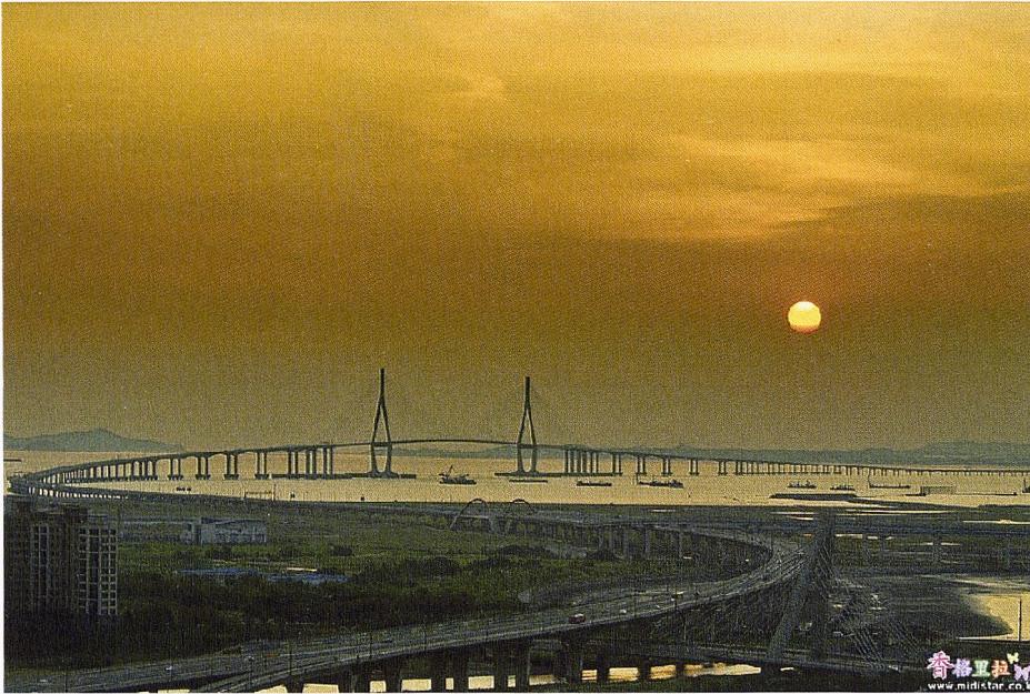
Sunset, Incheon Bridge, Korea