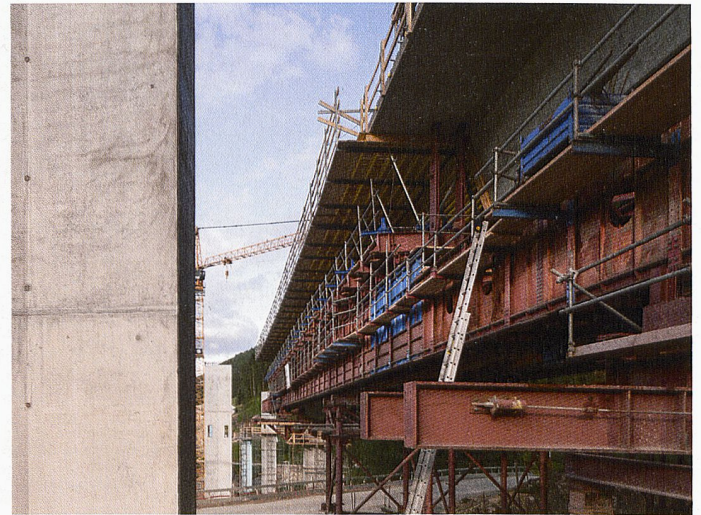
Construction des viaducs Eaux des Fontaines

SABAG BIEL/BIENNE, Rue J. Renfer 52, 2501 Bienne sabag.ch