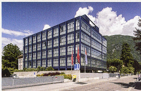
Institut de Recherche Biomédicale

Suite à l'intervention réussie des associations professionnelles tessinoises contre le concours pour le nouvel Institut de Recherche Biomédicale (IRB) de Bellinzona, le marché a été remis au concours. Que critiquaient les opposants au programme du concours d'origine ?