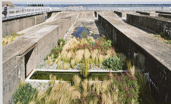
Gilles Clément, Le Jardin du Tiers-Paysage – Le Jardin des Orpins et des Graminées , toit de la base des sous-marins, Saint-Nazaire, création pérenne Estuaire 2012