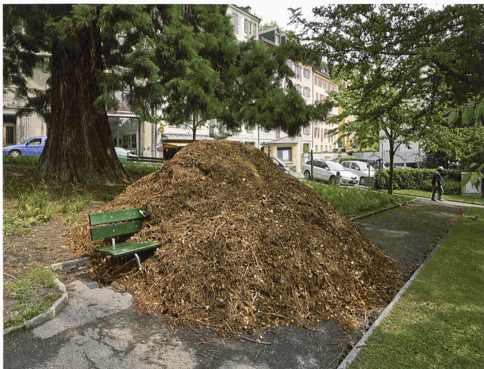
Dehors d'un bois