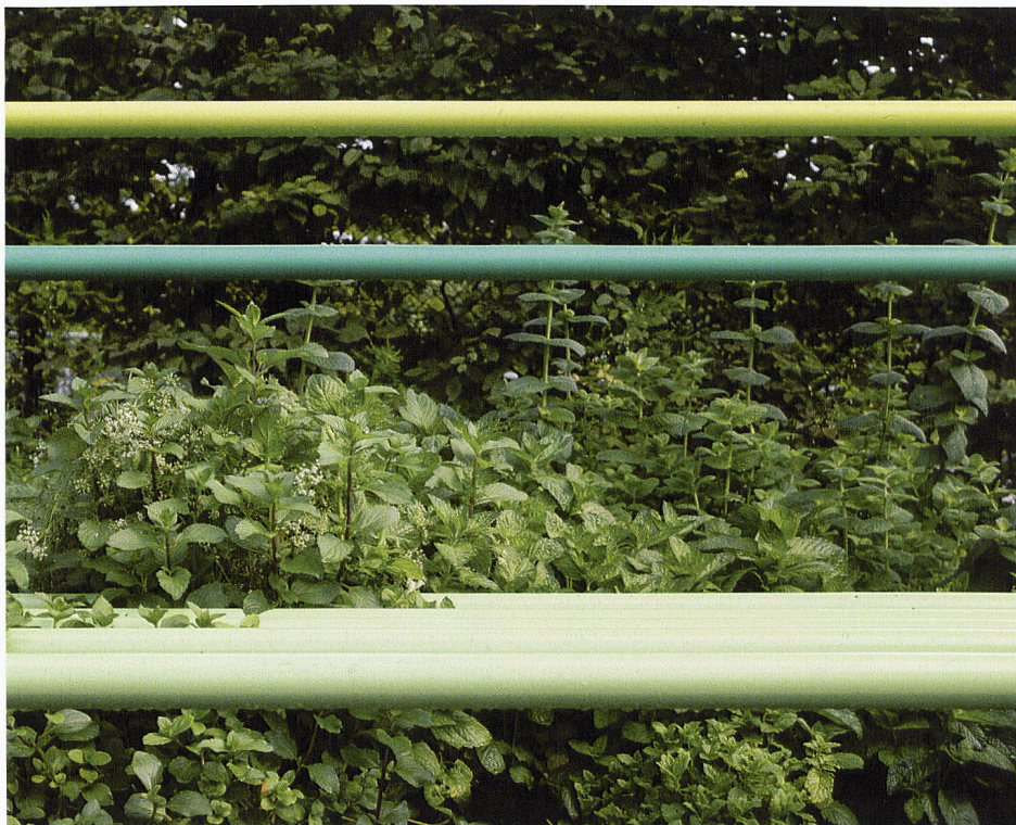
L'île verte

Le jardin implanté sur le terrain de la Vigie, un boulo-drome encore en activité, est l'un des seuls de Lausanne Jardins qui ait valeur d'usage. L'intervention est simple, mais elle fonctionne : des tubes peints dans différents tons de vert servant de bancs ou de barrières, mais aussi des plantations – anis, menthe, sauge, asperge et absinthe – en libre-service, des éléments existants repeints et quelques cartes postales que le visiteur peut emporter. Les tubes peints évoquent les systèmes de tuyauterie des bâtiments – sorte de mini Beaubourg –, comme s'ils prolongeaient les conduites souterraines de la ville. C'est sans doute à partir de l'usage du lieu que les concepteurs ont pensé ce jardin, en employant un vocabulaire issu de la ville puis remodelé. La contrainte est ainsi devenue moteur de création.