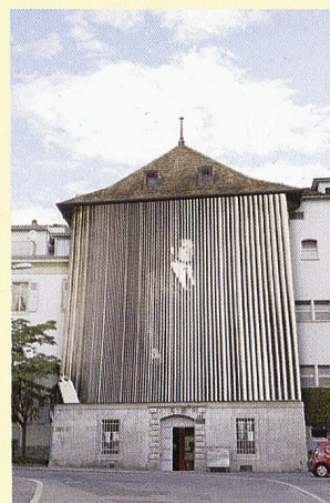
John Baldessari, Figure (with Vertical Lines) , 1999. (Photomontage Samuel Rouge)