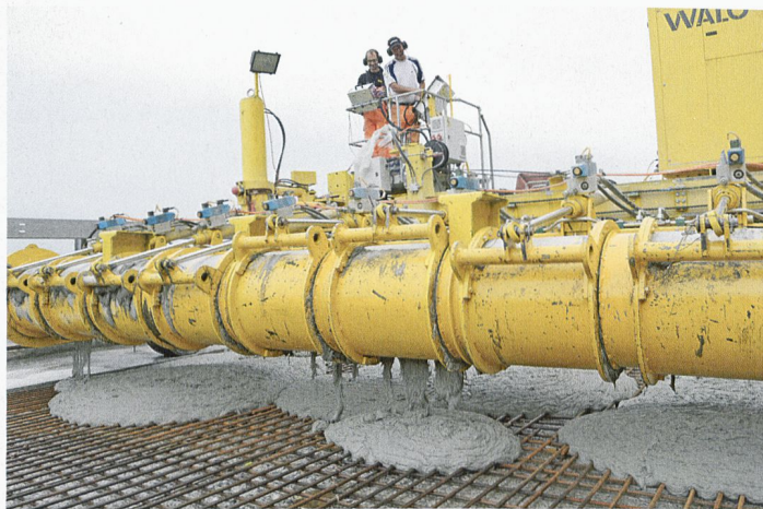
Coulage du béton devant la machine de pose