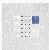
TC40 / Alu