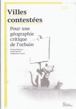
Villes contestées Pour une géographie critique de l'urbain Cécile Gintrac et Matthieu Giroud, Les Prairies Ordinaires, Paris, 2014 / € 24

Par la radicalité de leurs analyses, qui portent entre autres sur la financiarisation de la production urbaine, sur les trompe-l'œil que représentent le développement durable, la mixité sociale ou le multiculturalisme, sur les dispositifs de surveillance et de contrôle des populations, et plus globalement sur les formes de domination qui régissent les rapports sociaux en ville, les onze textes réunis dans ce recueil parviennent à identifier, et par là à contester les nombreuses contradictions spatiales et urbaines que le système capitaliste produit et reproduit. Ils nourrissent ainsi une géographie critique de l'urbain et, indirectement, une critique en profondeur des sociétés contemporaines. réd