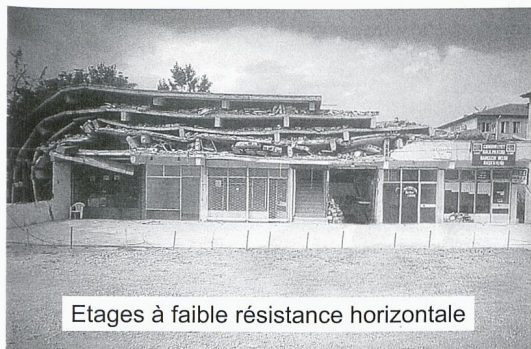
Etages à faible résistance horizontale

Construire parasismique ne coûte pas cher