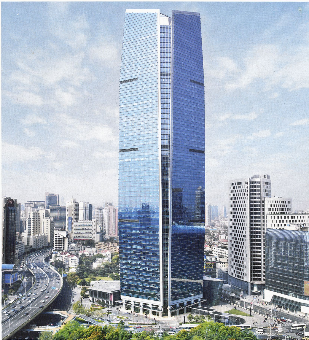
Wheelock Square, Shanghai