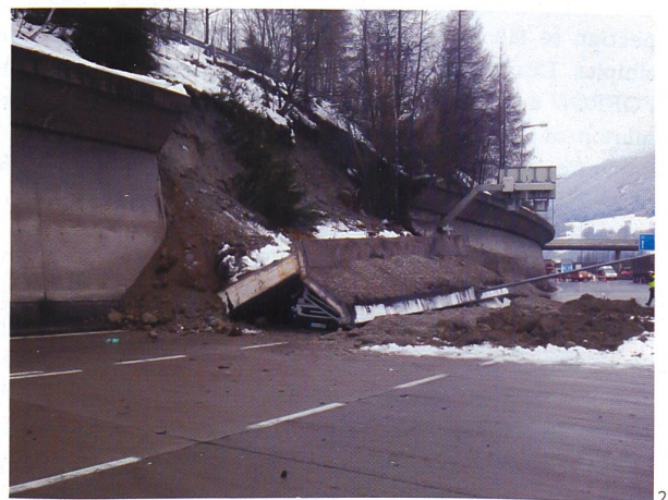
2 Effondrement du mur de soutènement Schönberg en Autriche, 20.03.2012 (Sauf mention, tous les documents illustrant cet article ont été fournis par les auteurs.)

Des rapports « Etudes et travaux 2006 – 2013 – rétrospective et expériences » et « Evaluation de l'état des murs de soutènement béton à semelles - Etude pilote - Rapport de synthèse des phases 1 et 2 » établis par GUMA seront joints en annexe à la fiche technique de manière à transmettre une information complète sur toute l'expérience acquise. Ces documents seront mis à disposition librement sur le site Internet de l'OFROU: www.astra.admin.ch dans le courant de l'année 2016.