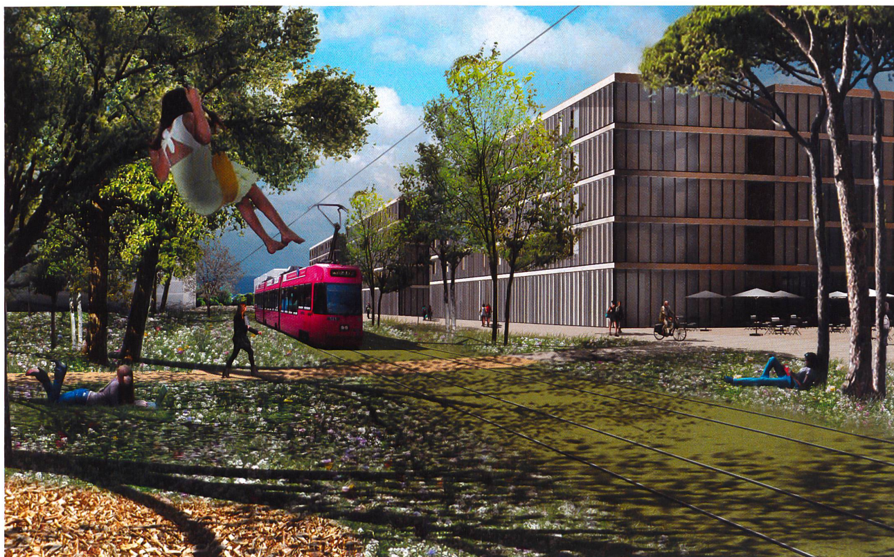
4 Visualisation d'une nouvelle polarité urbaine développée dans le cadre du projet interdisciplinaire Green Density (© LAST 2013)

La transformation des territoires métropolitains entre de surcroît en résonance avec une autre mutation sociétale, celle liée à la transition énergétique. La mise en œuvre d'une société à 2000 Watts, respectivement la décision de principe de sortir progressivement du nucléaire, implique en effet une réduction massive des besoins énergétiques et un recours largement prioritaire aux énergies renouvelables 11 . Dans ce contexte évolutif, les interactions entre les consommateurs et les producteurs seront de moins en moins centralisées. En termes de projet urbain, cela tendra à accroître les besoins de cohérence entre les stratégies spatiales et énergétiques.