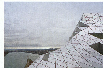
Couverture: Façade pignon en béton apparent du MEG à Genève; 4 e de couverture: sur la toiture du musée des Confluences à Lyon