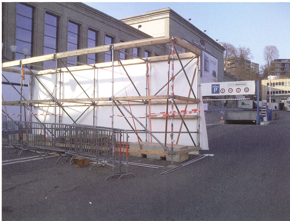
1 Habitat-Jardin c'est terminé pour 2015 (Photo CC)