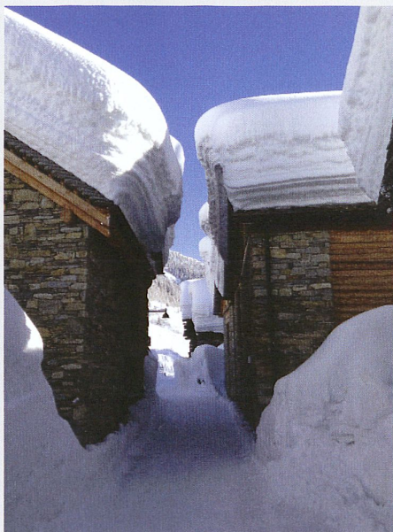
Les structures porteuses subissent souvent de fortes charges, notamment dues à la neige : maisons enneigées à Bosco Gurin (TI). (© Ruth Tomamichel)

Au chapitre 10 Trafic routier , le chiffre 10.2.1 a été remanié pour mieux décrire la disposition des charges selon les différents modèles et il est désormais intitulé « Voies de circulation fictives » au lieu de « Division de la chaussée ». La poussée des terres due aux charges routières qui s'exercent sur les ouvrages de soutènement a été définie plus précisément.