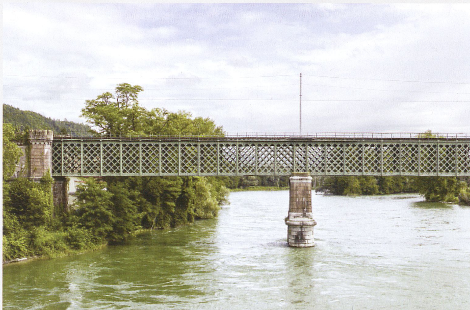
Depuis 1859, la structure en treillis du «Gitterlibrücke» enjambe le Rhin près de Koblenz AG.

Eugen Brühwiler ne se cantonne toutefois pas au monde abstrait de la science des