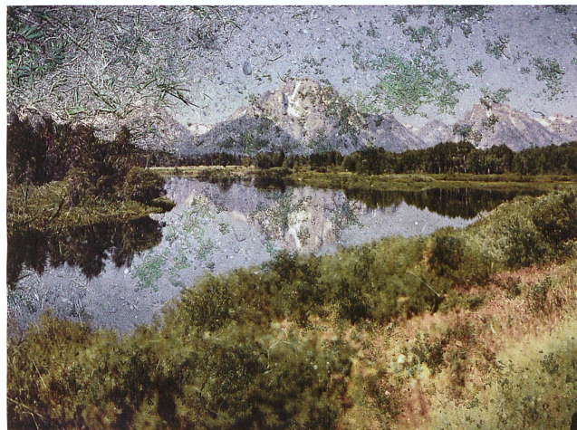
Tent-Camera Image on Ground: View of Mount Moran and the Snake River From Oxbow Bend, Grand Teton National Park, Wyoming, 2011