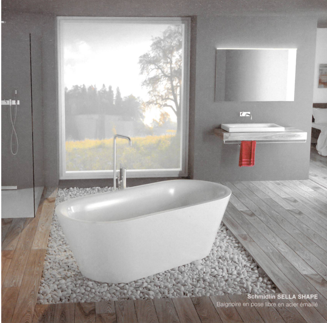
Schmidlin SELLA SHAPE Baignoire en pose libre en acier émaillé