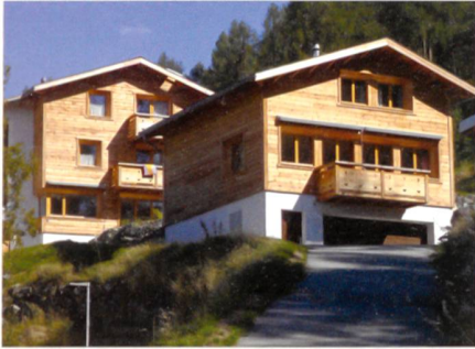
Fig. 1: Maisons Lundström, deux maisons Minergie-P-ECO à Nax (VS)