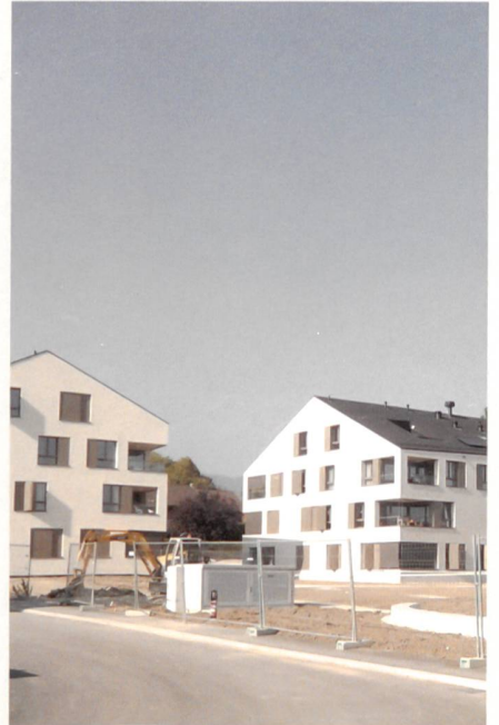
Fig. 3: Cinq immeubles de logements à Borex (VD) (photo A130 architectes Sârl)

dernier. Des termes comme habitat frugal ou habitat sain ont fait leur apparition (fig. 1). C'est là une tendance architecturale qui se veut plus proche de la nature, plus en phase avec son contexte aussi. Forme, organisation, matières tendent de plus en plus vers une refonte de la relation que nous avons au « naturel ». Plusieurs projets présentés durant les Journées SIA proposent d'explorer les couples nature-culture ou naturel-artificiel.