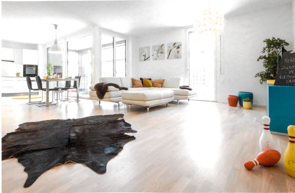
199 systèmes d'aération multilocaux Ego®Fresh dans l'objet de référence MINERGIE® Aletsch Campus, Naters.

La tendance va vers les systèmes d'aération intelligents; dans ce contexte, les appareils d'aération décentralisés pour chaque pièce deviennent de plus en plus intéressants, pour plusieurs raisons. D'une part, une aération décentralisée telle Ego®Fresh est plus économique qu'un système centralisé en raison de la conception plus simple et du coût d'installation plus intéressant. D'autre part, Ego®Fresh est aussi très bien adapté aux réhabilitations.