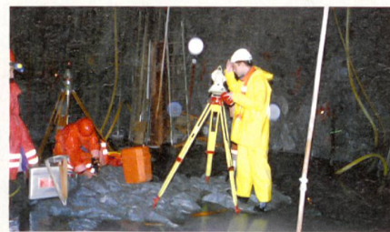
Grâce aux géomètres, les ouvrages sont érigés exactement à l'endroit prévu.

Au cœur de la montagne, il est impossible d'utiliser un GPS: autrefois, on s'orientait au moyen d'un cheminement polygonal à partir de chaque portail (mesure des points dans l'axe en déterminant les angles et les distances), alors qu'on recourt dorénavant à une triangulation sophistiquée. En d'autres termes, on crée un réseau très dense et sur-déterminé de points mesurés à plusieurs reprises. Le principe paraît simple, mais la tâche dans le tunnel ne l'est pas, car en plus de l'addition d'erreurs angulaires, des strates d'air chaud variables provoquent également des réfractions diverses de la lumière, c'est-à-dire du faisceau de mesure. Des erreurs et des divergences non négligeables peuvent en résulter. Il a fallu répéter souvent les mesures de contrôle et d'appui (dans ce projet, à peu près tous les deux kilomètres) à l'aide d'un gyrothéodolite (une toupie tournante qui