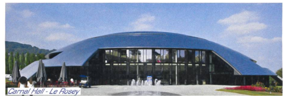
Carnival Hall - Le Rosey

Ch. I.-de Montolieu 161 - 1010 Lausanne Tél. 021 601 44 59