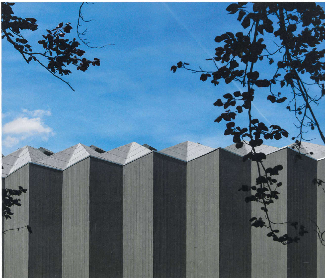
6 Vue latérale du pavillon, 21 mai 2017

les angles de fraisage au niveau machinerie pendant la phase de l'avant projet. C'est un peu comme concevoir un bâtiment avec ceux qui vont le monter.