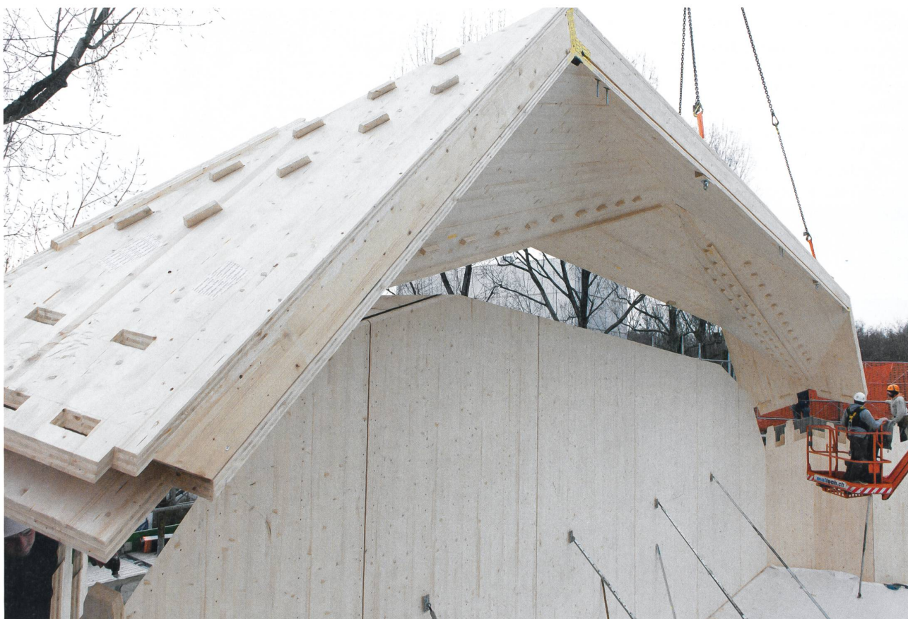
3, 4 Pose de l'une des arches du pavillon, 24 avril 2017