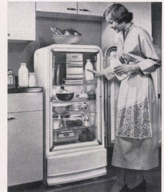
FRIGIDAIRE-Master-Kühlschrank von 170 Liter Inhalt in Standard-Ausführung mit Tiefkühlabteil, 2 Eiswürfelfladen, Hydrator, Kälteregele und automatischer Innenbeleuchtung.

Original FRIGIDAIRE 1980 kWh * Gleichtags durch einen FRIGIDAIRE MJ-7 ersetzt. Generalvertrieb für die Schweiz: Applications Electriques S.A., Genf und Zürich.