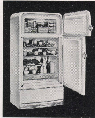
FRIGIDAIRE-Imperial-Kühlschrank von 285 Liter Inhalt in Luxus-Ausführung mit separatem Tiefkühlabteil, 4 Eisladen, Hydrator über die ganze Schrankbreite, Kälteregele und automatischer Innenbeleuchtung in beiden Abteilen.