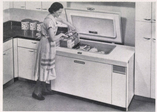
FRIGIDAIRE-Home-Freezer von 255 Liter Inhalt mit Innenbeleuchtung und unabhängigem Warnsignal, falls die Gefrieretemperatur überschritten ist.

Original FRIGIDAIRE 1980 kWh * Gleichtags durch einen FRIGIDAIRE MJ-7 ersetzt. Generalvertrieb für die Schweiz: Applications Electriques S.A., Genf und Zürich.