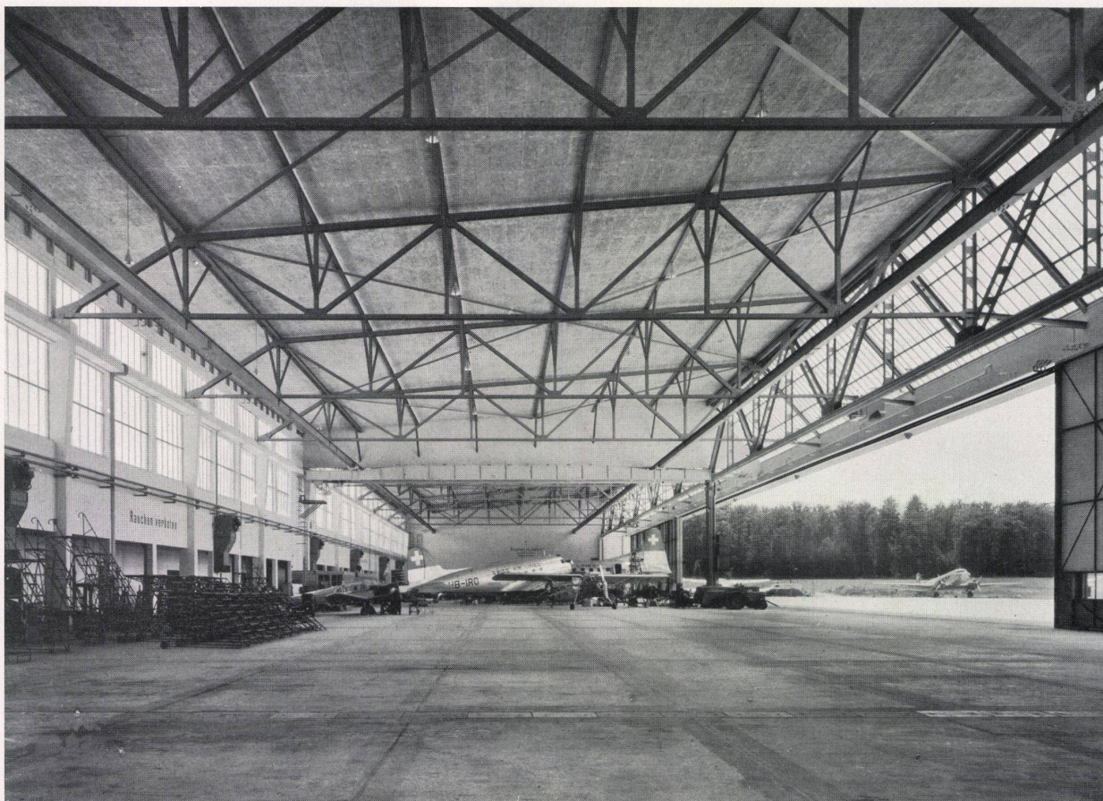
Werfthalle des Flugplatzes Zürich-Kloten (Länge 150 m, Tiefe 37,5 m). Projekt der Stahlkonstruktion durch die AG. Conrad Zschokke, Döttingen. Ausführung in Gemeinschaftsarbeit mit den Firmen Eisenbaugesellschaft Zürich und Geilinger & Co., Winterthur

Wir sind gerne bereit, Architekten über die Verwendungsmöglichkeiten des Stahles im Hochbau ausführlich zu orientieren, damit, dank der Zusammenarbeit von Architekt und Stahlkonstruktionsfirma, auch in der Schweiz vermehrt wirtschaftliche und formschöne Stahlhochbauten erstellt werden.