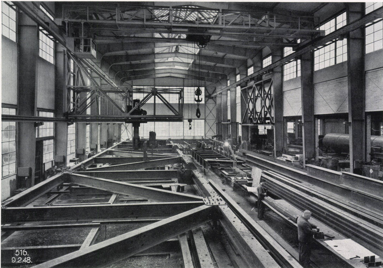
Werkstatthalle III der AG. Conrad Zschokke, Stahlbau und Kesselschmiede, Döttingen, Aargau