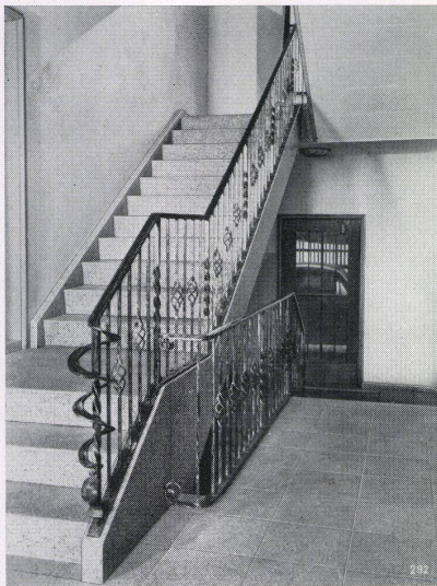
Schulhaus Flims Architekt Dr. sc. techn. Theod. Hartmann, Chur

Der Betrieb konnte seither bedeutend vergrößert werden, besitzt einen vorzüglich ausgerüsteten Maschinenpark, und befaßt sich vornehmlich mit der Herstellung von Spezialstücken in Beton und Kunststeinen. Durch die große Auswahl der Zuschlagsstoffe ist es heute möglich, die Steine in allen gewünschten Farbtönen herzustellen, was dem Architekten bei Fassadenverkleidungen und Treppenhäusern neue interessante Möglichkeiten bietet. Durch Schleifen, Fräsen und Polieren kann dem Stein die Struktur von Sandkalk oder Muschelkalk, Marmor oder Granit in verschiedener Ausführungsart gegeben werden.