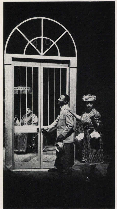
Szenenbild aus einer Karamu-Aufführung der Oper «The Medium» von Gian-Carlo Menotti. Scène d'une représentation au Karamu Center. Scene in a Karamu performance.